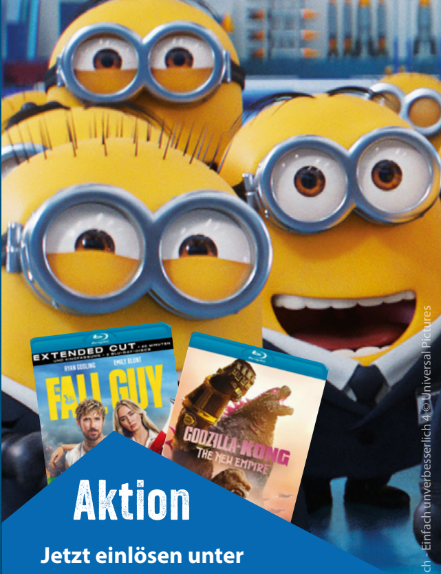
Ich - Einfach unverbesserlich © Universal Pictures

Bildnachweis Titelbild: Furiosa - A Mad Max Saga © Warner Bros. Film-Cover: 20th Century Studios, Alive AG, Arthaus, Koch Media Films, LEONINE, Lucasfilm, Plaion Pictures, Premiere Entertainment, Sony Pictures, Studiocanal, Universal Pictures, Universum Film, Warner Bros.