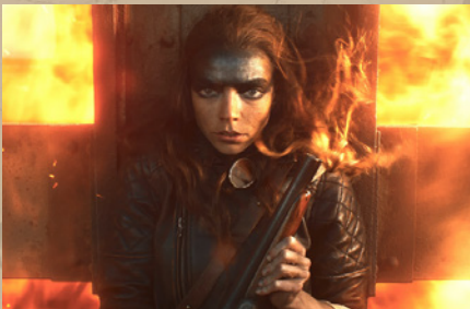
Anya Taylor-Joy in FURIOSA

Es ist an der Zeit... für Endzeit! Wir nehmen das Frontmotiv dieser MOV.I Ausgabe mit Anya Taylor-Joy als titelgebende FURIOSA neben Chris Hemsworth als Dementus zum Anlass, einen kurzen Blick auf die MAD MAX SAGA zu werfen, mit der Australiens Regisseur George Miller das Subgenre der Endzeitfilme ab Ende der siebziger Jahre, vor allem in Videotheken-Regalen mit immer reißerischeren Covern, so richtig ins Rollen brachte.